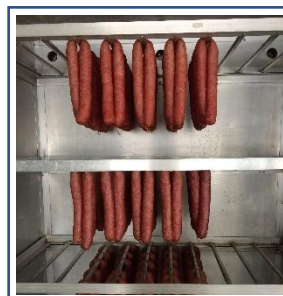
กุนเชียงผงครึ่ง