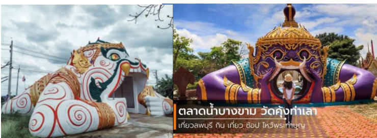
ตลาดน้ำบางขาม วัดคู้งท่าเลา เกี่ยวขบวน กับ เกี่ยว ฮอป ไหวพริกกัญ

เช่น พันธุ์พืช พันธุ์สัตว์ สายพันธุ์ จุลินทรีย์ สิทธิบัตร อนสิทธิบัตร เป็นต้น